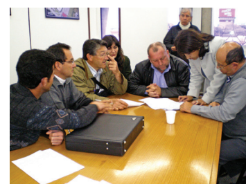
Assinatura dos diversos Acordos Coletivos de Trabalho por parte da Diretoria do SAEMAC e da Diretoria da Sanepar