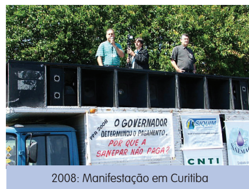
2008: Manifestação em Curitiba