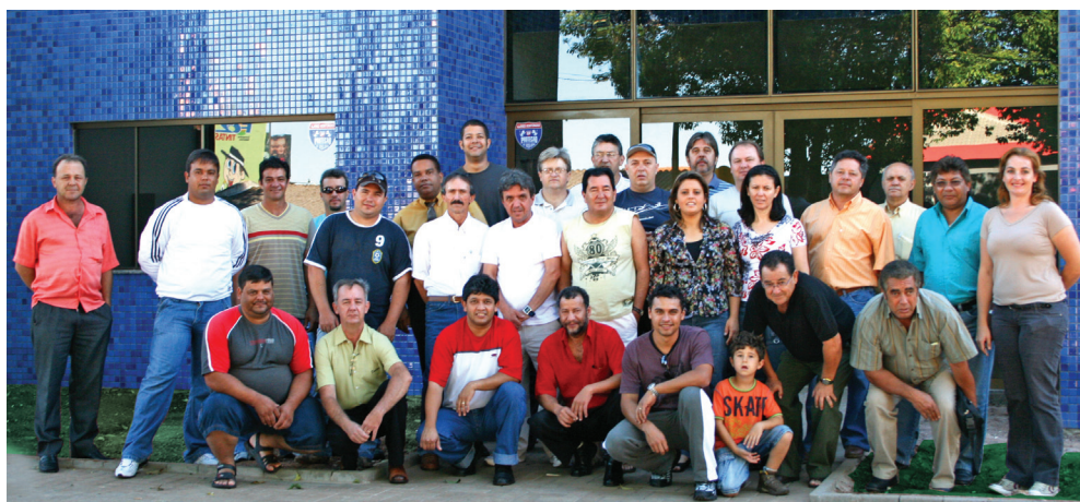
Representantes e Diretoria do SAEMAC em frente à sede de Cascavel