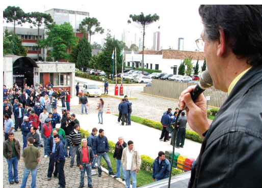
2009: Assembleia realizada em Curitiba

ORGULHO! Esta é a palavra que define o que sentimos hoje quando o assunto é distribuição dos lucros. Orgulho de ter conquistado essa igualdade dentro da Sanepar e inclusive nas demais estatais. Orgulho de cada trabalhador que esteve ao nosso lado.