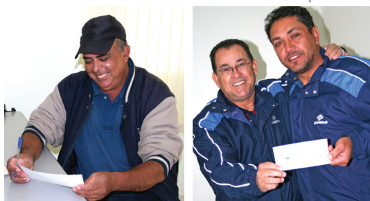
Os funcionários recebendo os valores da ação

O repasse dos valores aos funcionários envolvidos nesse processo foi efetuado em 2010.