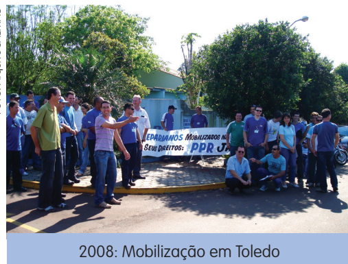
2008: Mobilização em Toledo