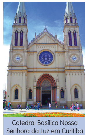
Catedral Basílica Nossa Senhora da Luz em Curitiba

O SAEMAC entrou com uma nova ação cobrando que o dia injustamente trabalhado fosse pago como forma de hora extra. A juíza foi favorável à reivindicação do Sindicato e deu ganho de causa aos trabalhadores; e a Sanepar foi obrigada a efetuar o pagamento das horas extras.