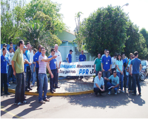
Manifestação de protesto - Toledo 05/10