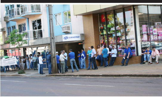
Paralisação - Cascavel 05-10-09