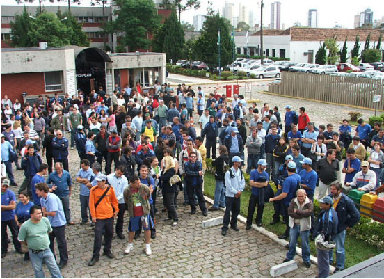
Assembléia Curitiba 15-10-09