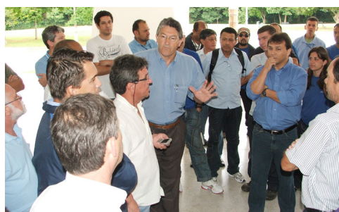
Escolinha do Governo 10-11-09

Após os dias 22 e 23/10, quando o Sr. Governador Roberto Requião determinou o pagamento do PPR, de forma Linear, iniciou-se um movimento por parte da Diretoria da Empresa, a fim de que o PPR fosse pago, não de forma Linear, mas sim de forma proporcional. A diretoria da empresa desenvolveu então, diversas planilhas com simulações com a forma de distribuição.