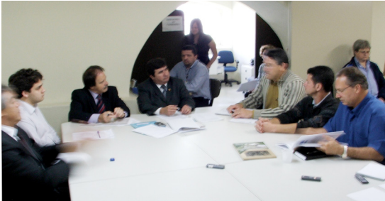
Câmara dos Vereadores - Curitiba 21/10/09