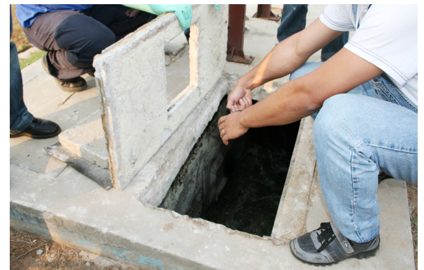
FOTO: Representantes Sindicais estiveram em Guarapuava na Estação de Tratamento, analisando o Ralf onde foram encontrados os corpos dos trabalhadores.

O SAEMAC protocolizou na Procuradoria Regional do Trabalho um ofício, solicitando o acompanhamento desta, para esclarecimento do fato ocorrido. Bem como, solicitamos a mediação da Procuradoria, para o agendamento de uma reunião entre o Sindicato e a Sanepar, a fim de averiguar as reais condições de trabalho a que estão expostos os empregados da empresa nas demais localidades.